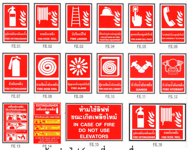
ตัวอย่างไฟล์ภาพที่แทรกเพื่อทดสอบ