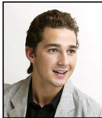
ภาพบุคคลผู้ชายแต่งหน้าเหมาะสม

(Shia LaBeouf from Transformers 1) : make up